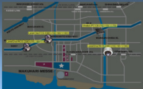
Intuitive E-Map GUI to indicate all the alarms