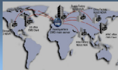
Remote desktop and configuration to manage remote server