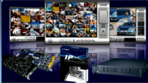
Manage all NUUO server and supported IP camera/video server